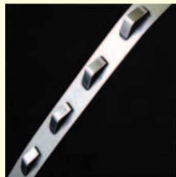
【ダンパースプリング】

ダンパースプリングを標準装備した1988年以降、ベローズの共振疲労破壊は1件も報告されていません。